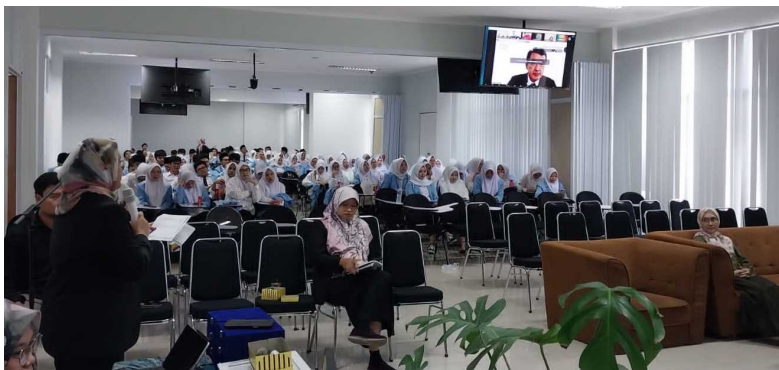
現地受講者の様子