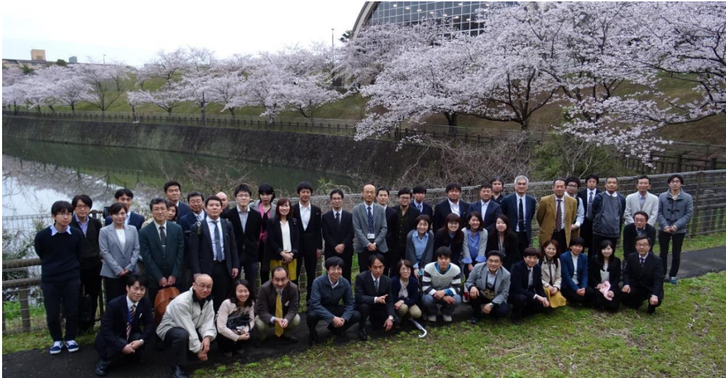
Cherry-blossom viewing party by IIES

The internal activities of IIES are globally recognized, and has been designated continuously as WHO collaboration center of occupational health by WHO since 1988. Participation of Korea-Japan-China conference of occupational health and periodical exchange program between Catholic University of Korea and IIES has been performed positively as part of training course of occupational physician.