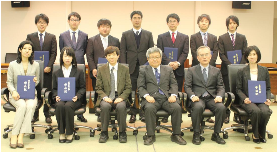
First completion ceremony of master course for Occupational Health (2016.3)