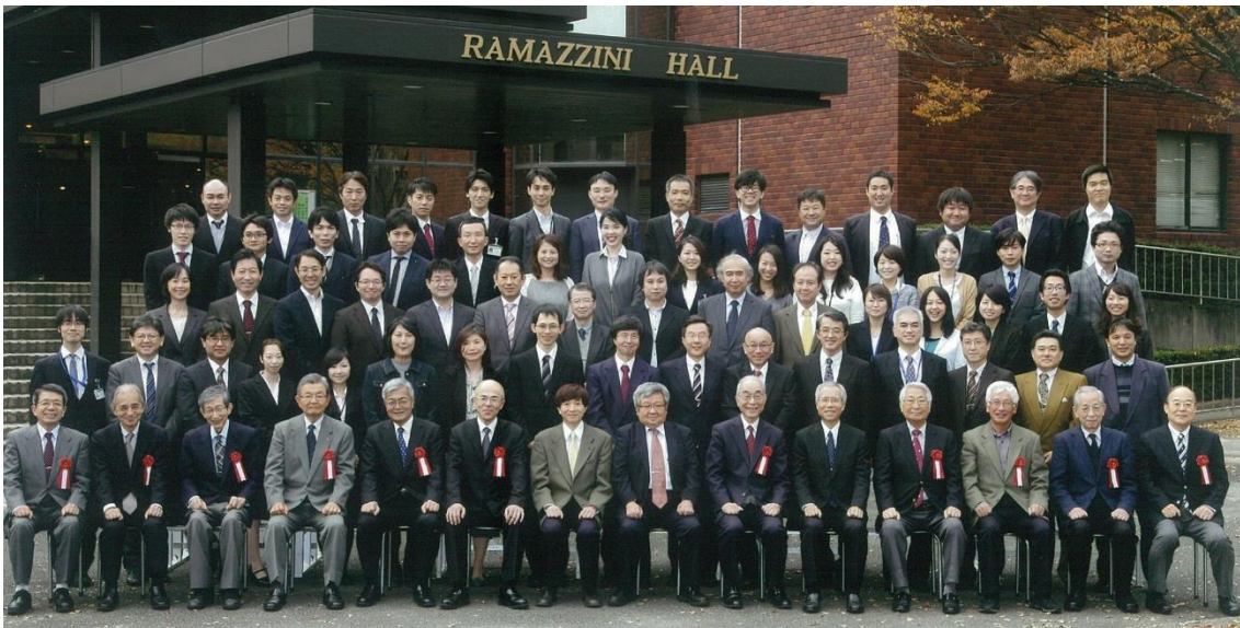
研究所創立 30 周年記念