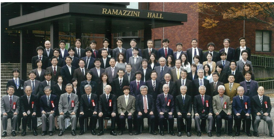
Ceremony of the 30 th anniversary of establishment of IIES