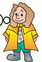
本学マスコットキャラクター ラマティー