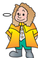
本学マスコットキャラクター ラマティエ