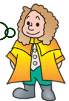
本学マスコットキャラクター ラマティ