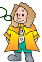
本学マスコットキャラクター ラマティエ