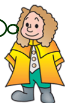
本学マスコットキャラクター ラマティー