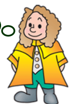
本学マスコットキャラクター ラマティー