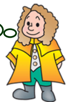
本学マスコットキャラクター ラマティー