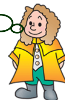
本学マスコットキャラクター ラマティ