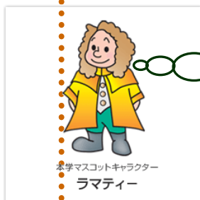
本学マスコットキャラクター ラマティエ