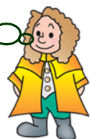
本学マスコットキャラクター ラマティー