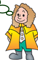
本学マスコットキャラクター ラマティ