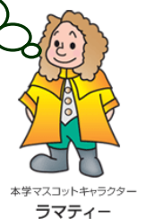
本学マスコットキャラクター ラマティー