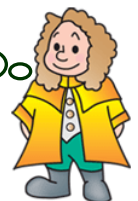
本学マスコットキャラクター ラマティー