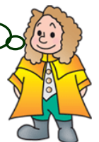
本学マスコットキャラクター ラマティー