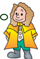
本学マスコットキャラクター ラマティー