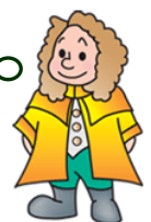
本学マスコットキャラクター ラマディー