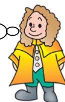
本学マスコットキャラクター ラマディー