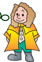
本学マスコットキャラクター ラマティー