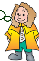
本学マスコットキャラクター ラマティー