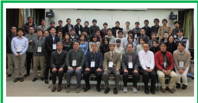
第8回 緩和ケア研修会 受講生

A課程、B課程の2つの課程を緩和ケア研修会標準プログラムで定められた内容・時間で実施し、形式は講義・ワークショップ・グループに分かれてロールプレイ(身体、精神、疼痛事例等)を行い、充実した2日間でした。今回の参加者人数は43名で、受講した医師には厚生労働省と福岡県から修了証書が発行されます。