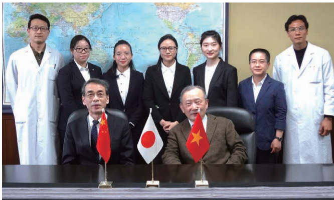
アジア国際産業医学研究者育成プログラムの受入れ Welcoming Graduates Students of Asia International Occupational Health Program