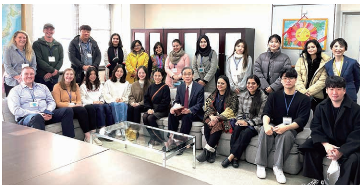
JST 国際青少年サイエンス交流事業 さくらサイエンスプログラム Sakura Science Exchange Program funded by the Japan Science and Technology Agency (JST)