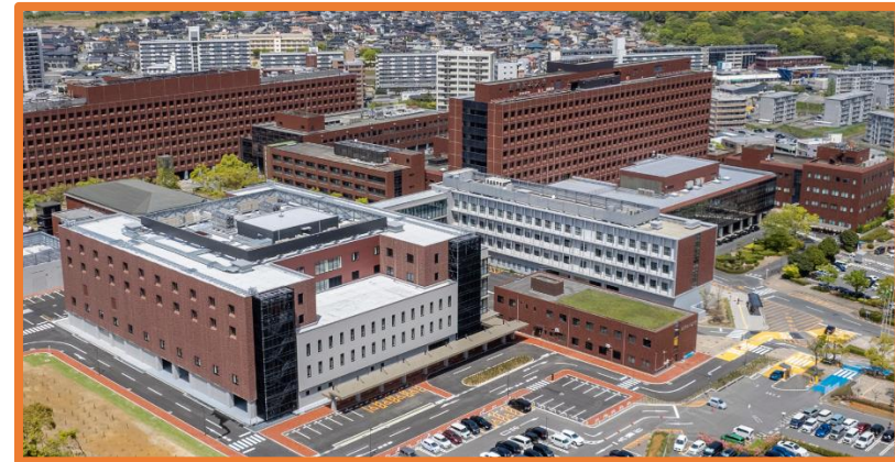
産業医科大学病院、産業医科大学