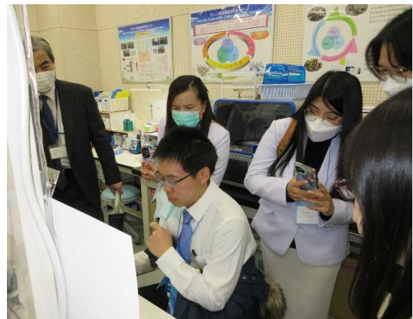
ストレス関連疾患予防センターの視察