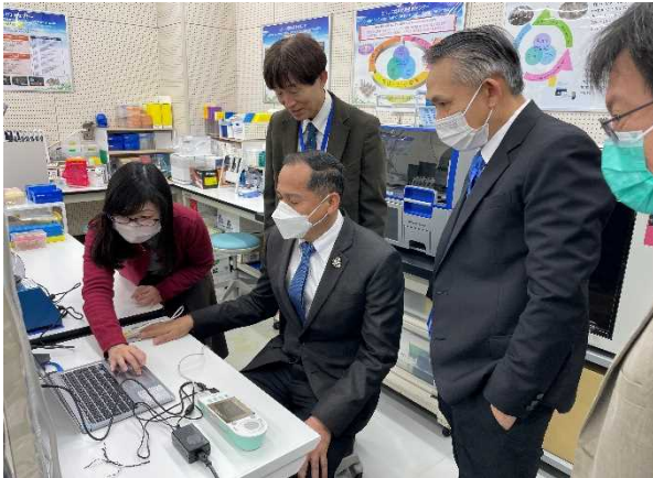
ストレス関連疾患予防センターの見学