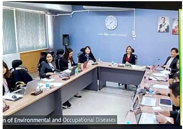
タイ保健省疾病管理局(オンラインの様子)