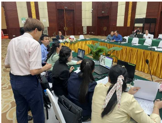
じん肺の胸部レントゲン写真の読影の実習風景