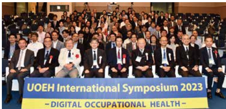
産業医科大学国際シンポジウムの開催 Organizing UOEH International Symposium