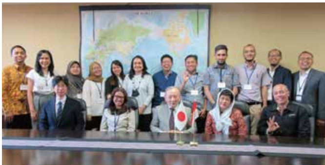
JST 国際青少年サイエンス交流事業 さくらサイエンスプログラム Sakura Science Exchange Program funded by Japan Science and Technology Agency (JST)