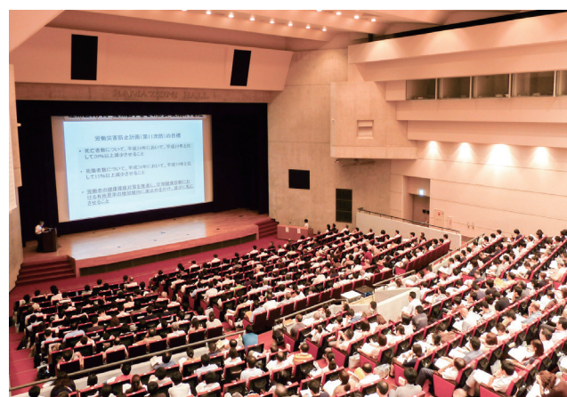
産業医学基礎研修会集中講座

また、産業医学実践研修は、本学において長年にわたる産業医養成の取組で構築された実践的な研修であり、受講者の経験・専門レベルを想定して様々なテーマでプログラムを開発し、東京・大阪等の都市で実施しています。