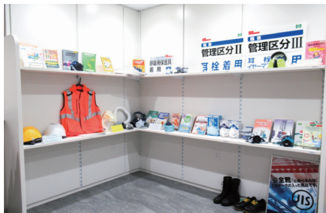
保護具展示コーナー Protective Equipment Display Area