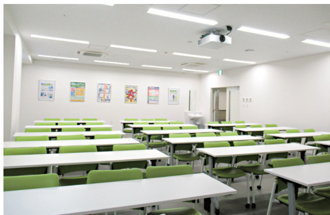
講義室 Lecture Room

The Center was established within the newly opened Acute Care Facility in August 2023 as an educational and training facility to address the diversified health needs of workers. It is equipped with a lecture room, a protective equipment display area, a room with local exhaust ventilation, a room with an air intake port, and other amenities, and is widely used as a training venue for professionals involved in occupational health.