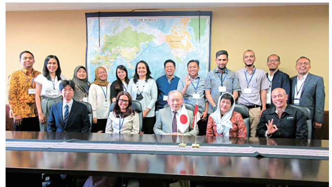
JST 国際青少年サイエンス交流事業 さくらサイエンスプログラム Sakura Science Exchange Program funded by Japan Science and Technology Agency (JST)