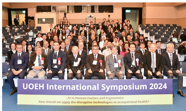
産業医科大学国際シンポジウムの開催 Organizing UOEH International Symposium