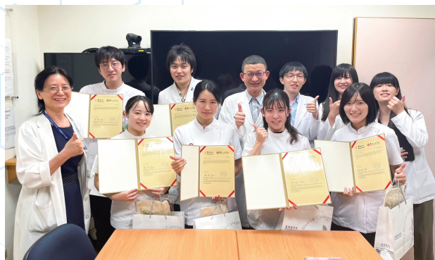
医学部交換医学教育(学生派遣) Medical Education Exchange Program