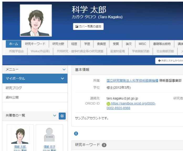
マイポータルイメージ