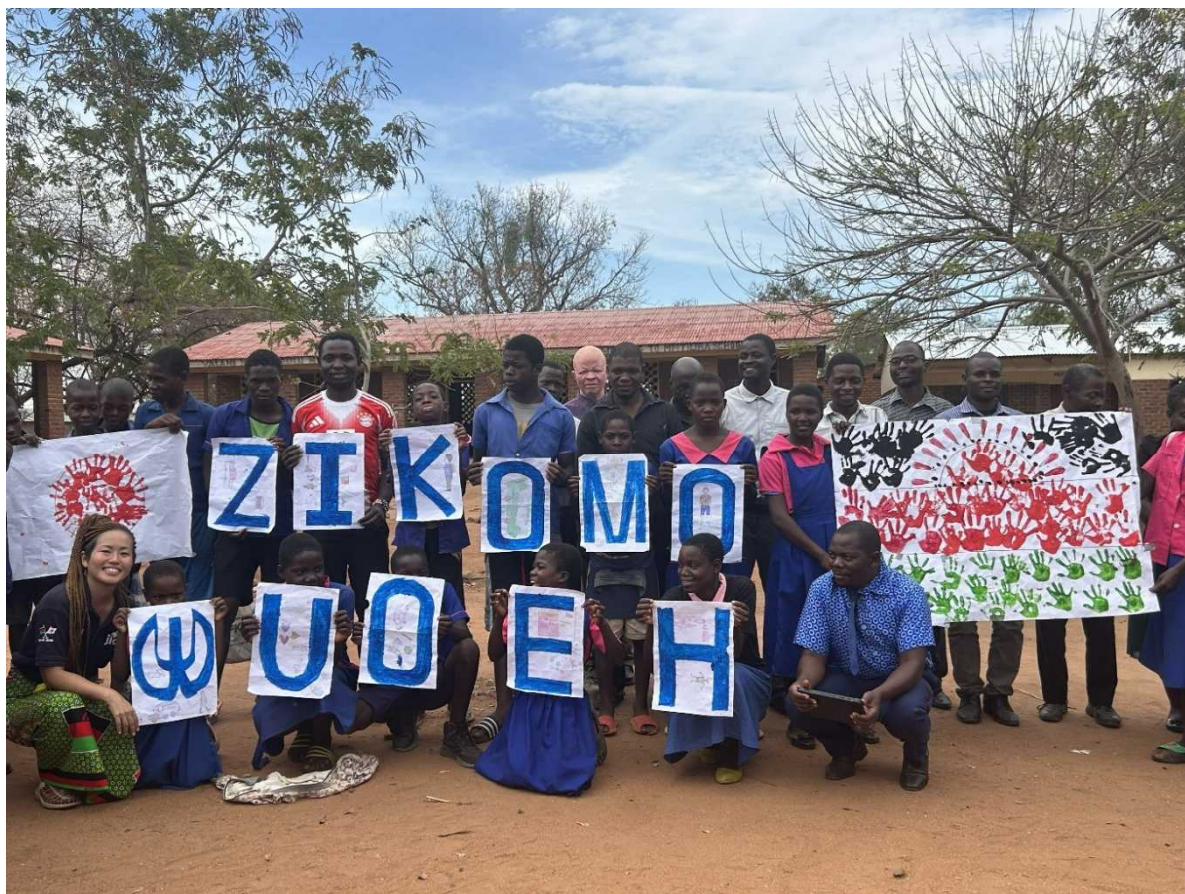
診療所と近隣の小学校が協同で作成した御礼状①（ZIKOMO は現地語で「ありがとう」）