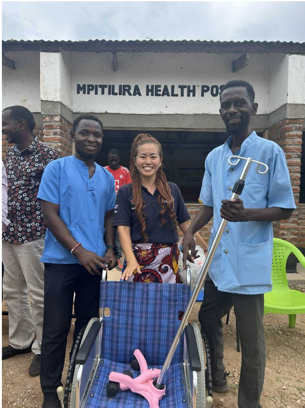
診療所職員への寄贈の様子