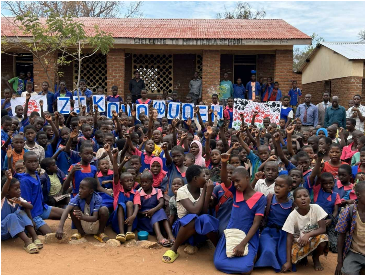
診療所と近隣の小学校が協同で作成した御礼状②