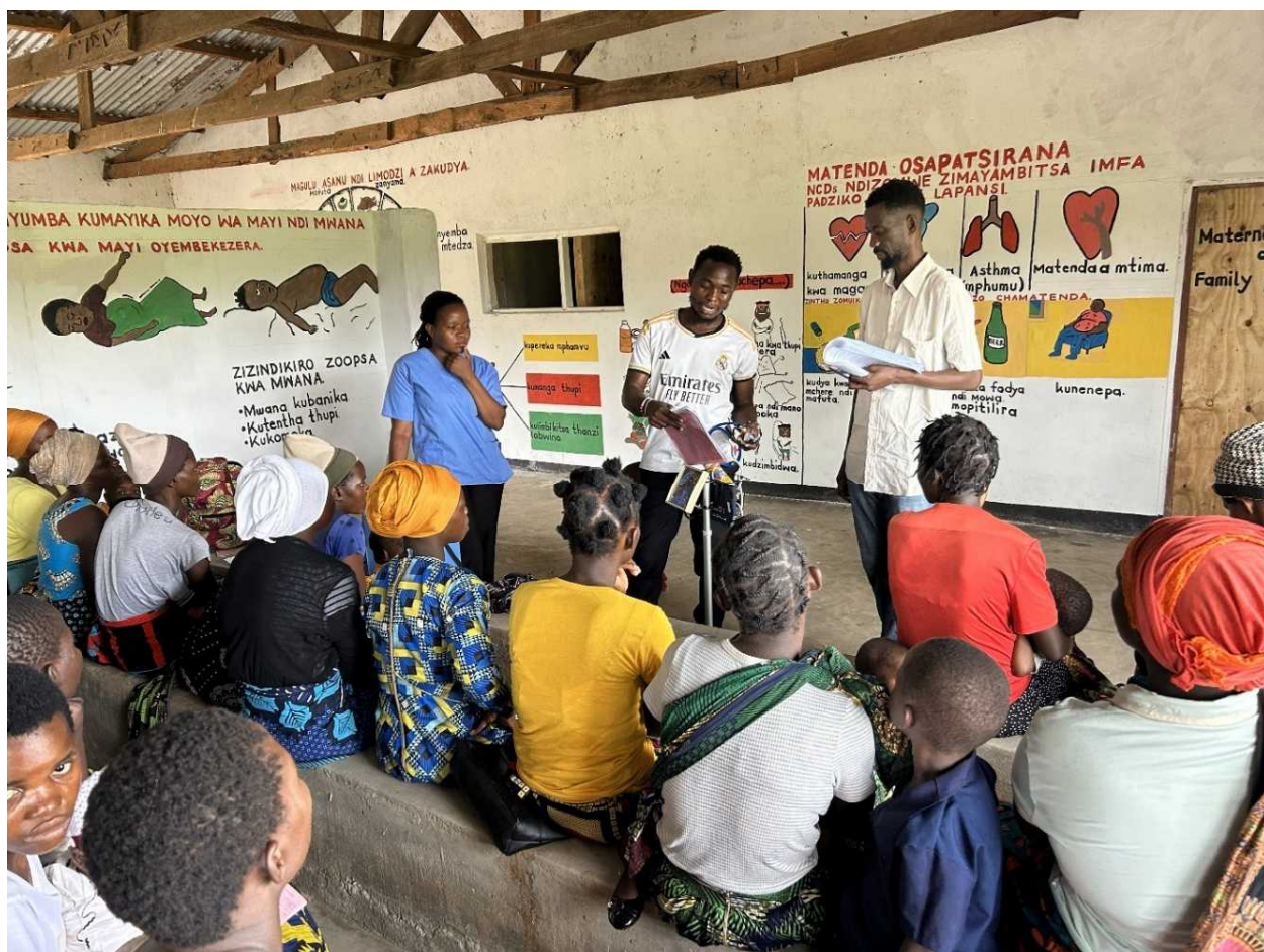
診療所職員による手動血圧計を用いた健康啓発活動