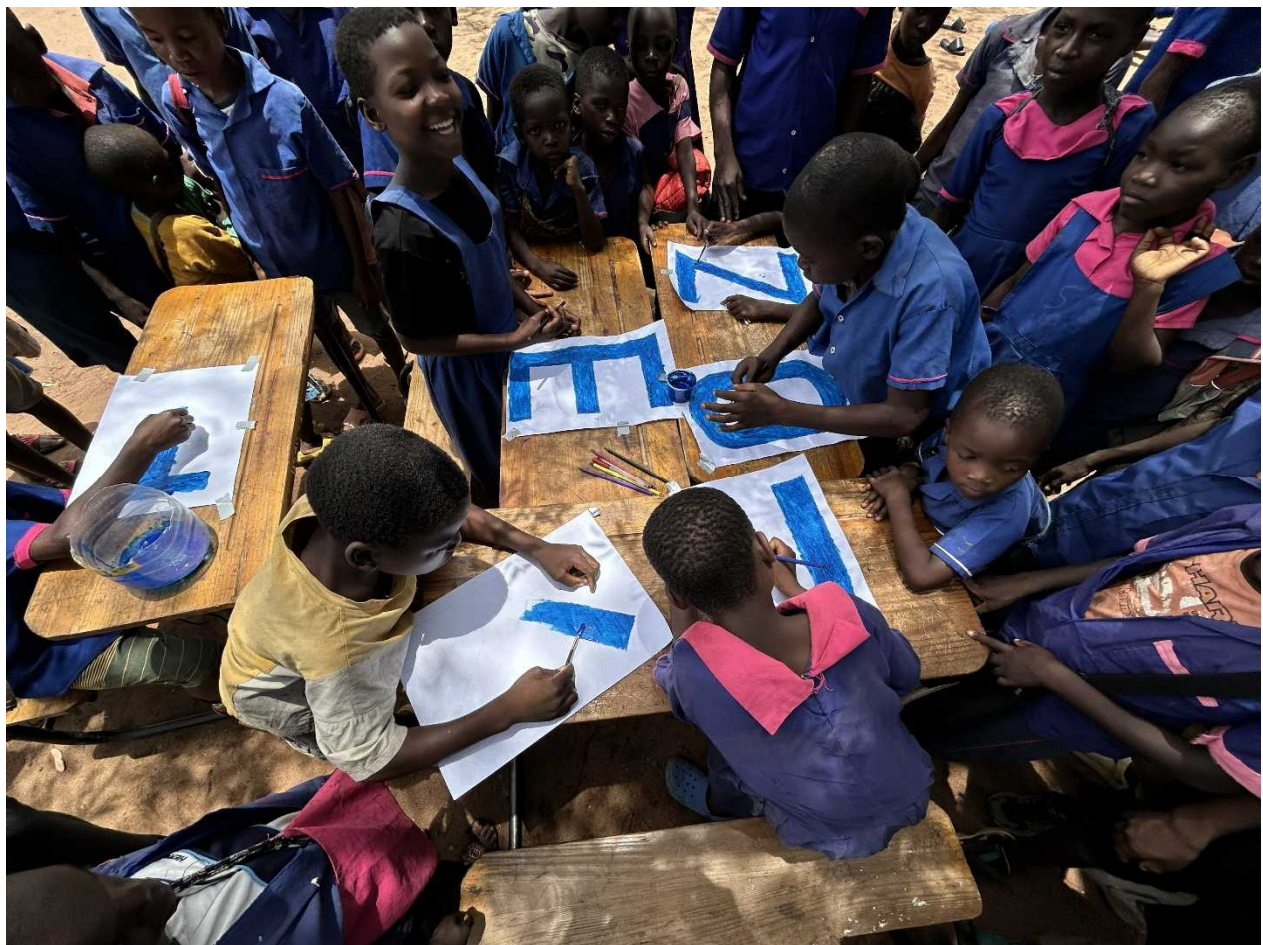
現地小学生の御礼状作成の様子