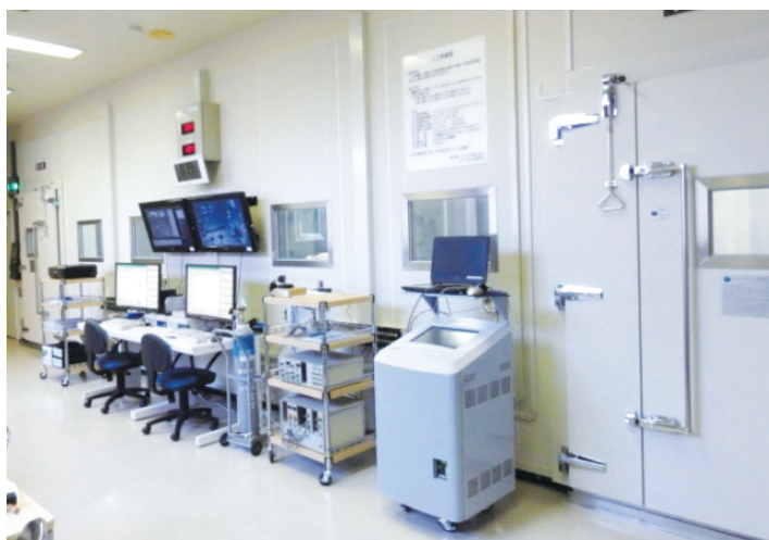
人工気候室 Artificial Climate Chamber

Research fields in medical and life sciences are becoming much more specialized and compartmentalized, and along with those changes, research environments are also changing greatly. The Shared-Use Research Center includes highly functional and advanced scientific instrumentation and various types of technical equipment, such as an anechoic chamber and an artificial climate chamber for use in experiments in special environments. The center, as a research facility for shared-use, is designed to be of use not only for education and research in the field of occupational and environmental health but also in that of other diverse research.