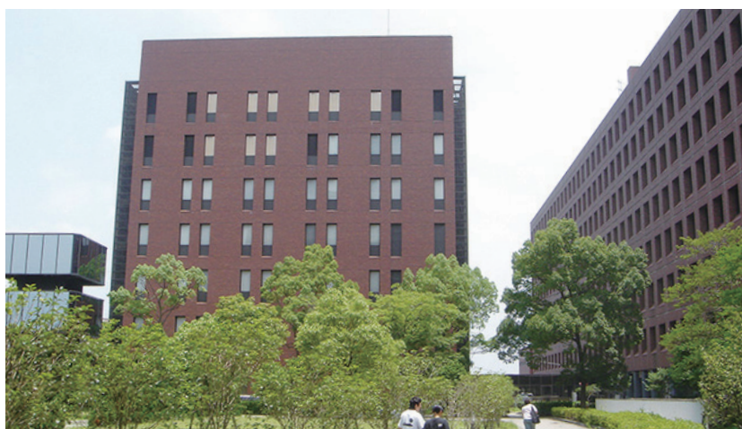
アイソトープ研究センター Radioisotope Research Center

自動入退室管理システムにより、各研究者の自主規制のもとにいつでも実験が行えることを基本としています。