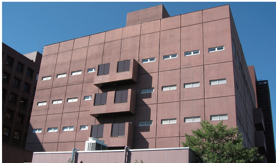
動物研究センター Animal Research Center

Experiments using animals has become increasingly important as medical science develops. In order to respond to changes, the Animal Research Center maintains an environment where SPF animals and genetically modified animals can be bred, and supports the breeding of genetically modified animals in order to be able to clarify the function of genes at the individual level. The center has facilities such as the infection experimenting laboratory, embryo manipulation laboratory, climatic chamber laboratory, photo environment experimenting laboratory, aquatron laboratory, X-ray irradiation laboratory, anechoic laboratory, and P3 laboratory, etc. to correspond with occupational health studies.