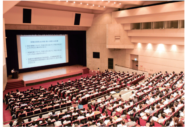
産業医学基礎研修会集中講座

The Occupational Health Practicum Workshop provides practical, hands-on training based on many years of engagement in educating occupational health physicians. It develops programs on a wide range of themes tailored to participants' different levels of experience and expertise, and is held in Tokyo, Osaka, and other cities.