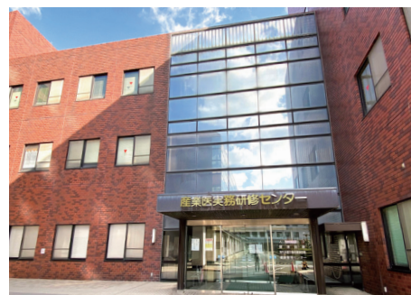
産業医実務研修センター Occupational Health Training Center

学外に対しては、長年にわたり蓄積された産業医学の知見や経験を活用し、社会貢献として多くの研修事業を提供しています。主なものとして、産業医資格取得希望者に向けた産業医学基礎研修会集中講座や全国で産業保健専門職を対象とした産業医学実践研修があります。その他、産業医科大学によるCOA方式メンタルヘルスサービス機関機能認定(MH認定)事業の業務本部も担っています。