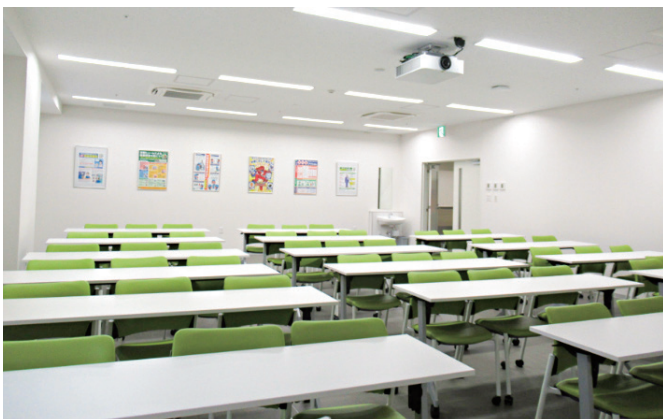
講義室 Lecture Room

Established in August 2023 within the Acute Care Building, this facility serves as a center for education and training designed to meet the increasingly diverse needs of worker health management. In addition to lecture rooms, it is equipped with a range of specialized facilities, including a protective equipment display area, a local exhaust ventilation room, and inhalation rooms. It is widely used for practical training in occupational medicine and for specialized training programs for occupational health professionals.