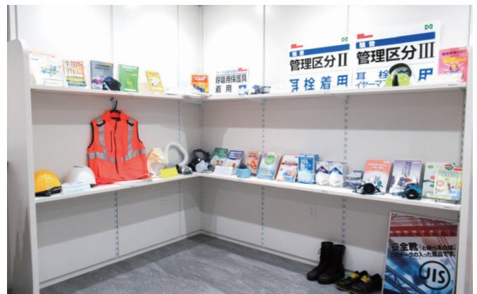
保護具展示コーナー Protective Equipment Display Area