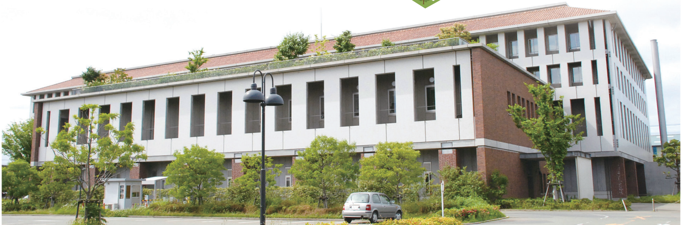
③1 産業医科大学若松病院 Wakamatsu Hospital